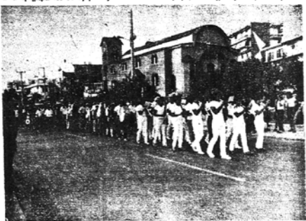
Η Φθαρμένη Λαϊκάδα, στο πανηγύρι μας το 1985

μύνη του Λευκαδίου όλων της Αττικής, να πορευθούμε στον Εσπερινό και τη λιτανεία της Εικόνας της Θεοκορμίσσης και κατόπιν εκεί κοντά όπου παρτίδα να στεφάνει η νύχτα, να να βίσουν στα τραπέζια, να σερβίρουν, να πούν και να χορέψουν, τριάντας την παράδοση του τόπου μας.