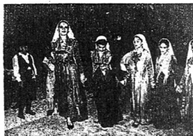
Το χορευτικό αναίρει το χορό στο πανηγύρι

Ανυψώσαμε στο εσπιατόριο του «Γιόργου», που είναι κο-