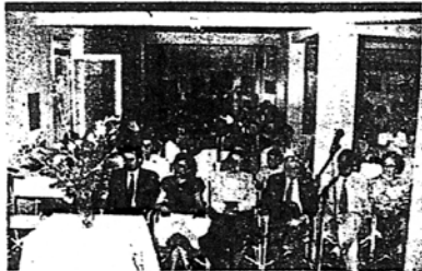
Από την εκδήλωση της 31 Μαΐου 1992

Όμορφες ήταν οι απαγγελίες ποιημάτων Βαλαωρίτη και Σικελιανού από τους νέους και ευγενείς ηθοποιούς, τους γελοιστούς και γεμάτους χάρη ηθοποιούς, κυ-