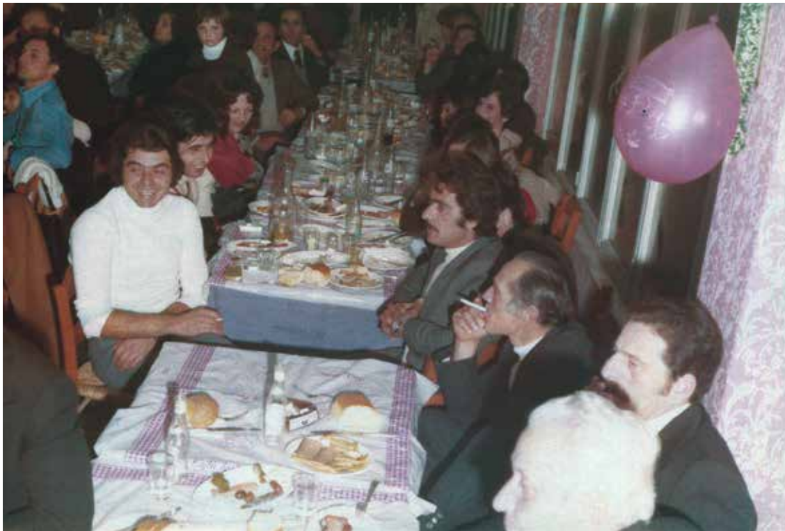
Κοπή πίτας, 1978, στο «Τρύπιο Κατοστάρι»