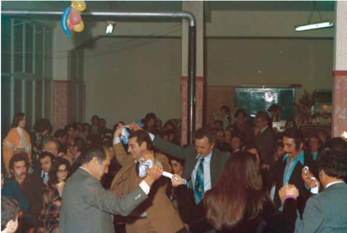
Κοπή πίτας 1981, στην Ηλιούπολη