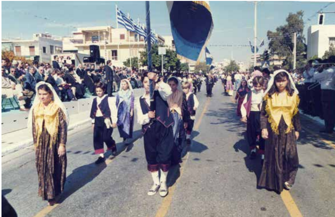
28 Οκτωβρίου 1992

Συμμετέχει στον εορτασμό των Εθνικών Επετείων, στην Ηλιούπολη, με κατάθεση στεφάνου και συμμετοχή του Χορευτικού τμήματος στην παρέλαση.