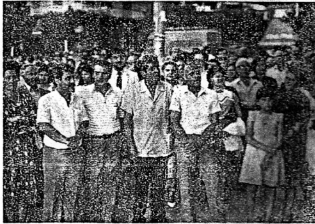
Την ώρα του Εσπεριού

Ο εξωραϊστικός συμμετείχε στην εκδήλωση της Κυριακής με το στίλβηρό μας στις προστάσεις και τις προετοιμασίες και στη δουλειά που