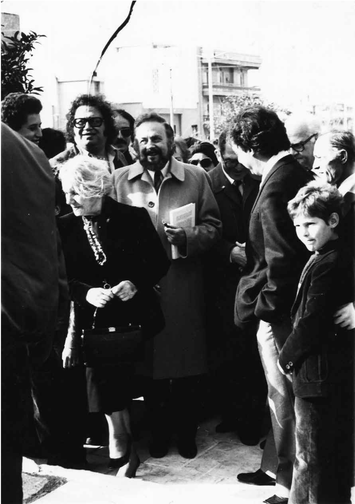
Στράτος Θεριανός, Γιάννης Ρίτσος, Άννα Σικελιανού