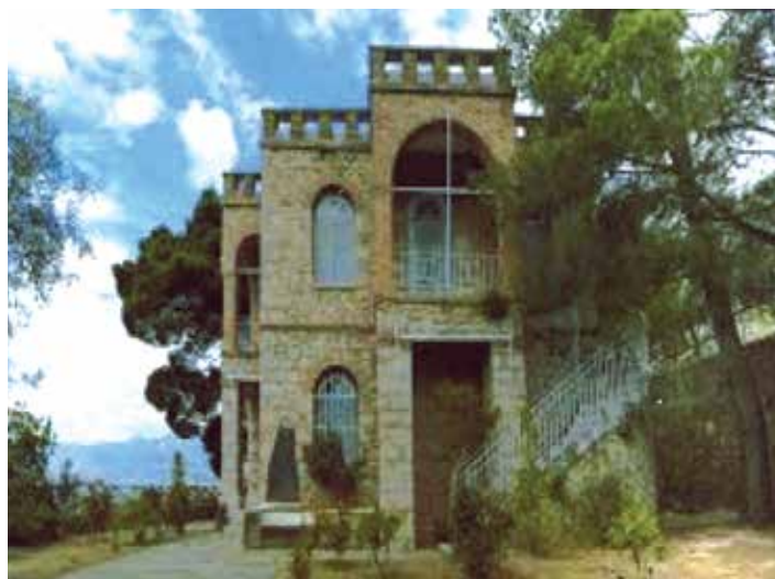
Η οικία του Σικελιανού στους Δελφούς