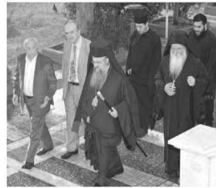
ΣΤΟΝ ΙΕΡΟ ΕΝΟΡΙΑΚΟ ΝΑΟ ΑΓΙΩΝ ΒΑΣΙΛΕΩΝ ΚΑΙ ΙΣΑΠΟΣΤΟΛΩΝ ΚΩΝΣΤΑΝΤΙΝΟΥ ΚΑΙ ΕΛΕΝΗΣ ΣΤΟ ΜΟΣΧΑΤΟ

Με κάθε λαμπρότητα έγινε η υποδοχή αντιγράφου της θαυματουργού Ιεράς Εικόνας της Υπεραγίας Θεοτόκου της Πεφανερωμένης